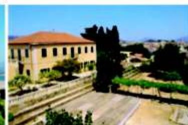
Η Ιακωβάτειος Βιβλιοθήκη